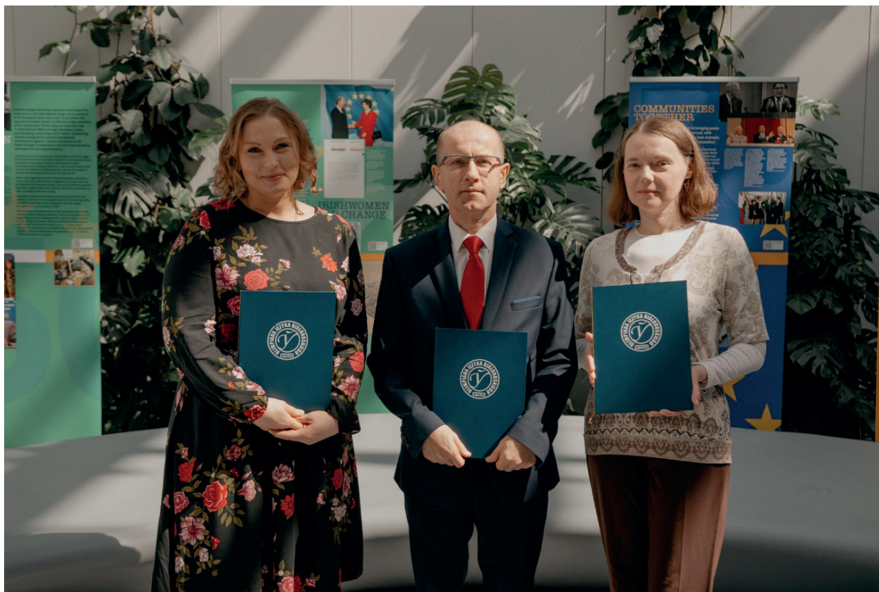
Nauczyciele języka białoruskiego z II LO z BJN w Bielsku Podlaskim i II LO z DNJB w Hajnówce podczas finału XXIX edycji OJB.

narodowej i dlatego szkołom i nauczycielom z Bielska i Hajnówki bardzo zależy na zachowaniu Olimpiady. Należy jednak podkreślić, że bez nauczycieli języka białoruskiego, którzy pracują na co dzień z młodzieżą, uczą ich języka i literatury białoruskiej oraz organizują dodatkowe zajęcia dla olimpijczyków, Olimpiada dawno przestałaby istnieć. Pozwala to wierzyć, że dalsze istnienie Olimpiady Języka Białoruskiej w Polsce nie jest zagrożone tak długo, jak w jej przeprowadzenie zaangażowani są zarówno członkowie Komitetu Głównego OJB, jak i szkoły średnie, nauczyciele języka białoruskiego i sama młodzież.