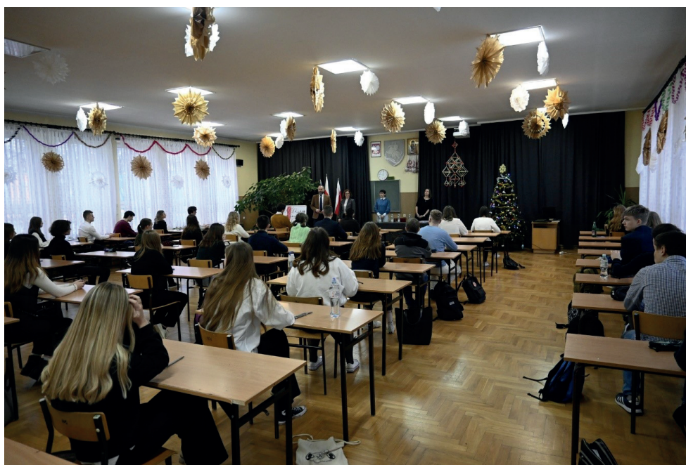
II etap XXIX edycji OJB w II LO z DNJB w Hajnówce