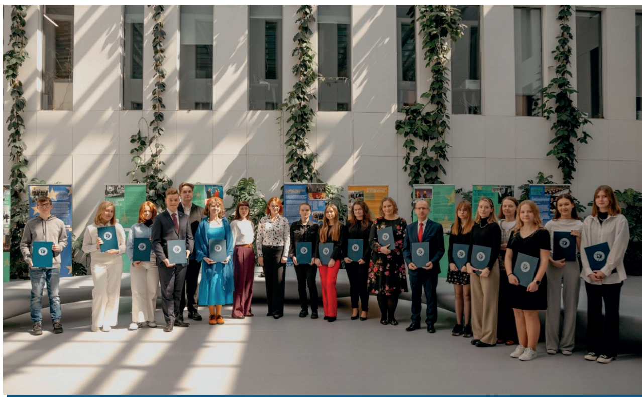
Członkowie Komitetu Głównego OJB, laureaci, finaliści i nauczyciele podczas finału XXIX edycji Olimpiady Języka Białoruskiego (25 kwietnia 2023 r.)